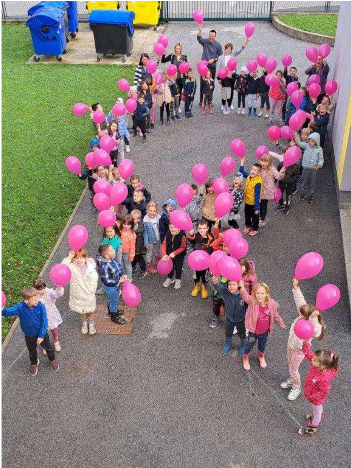
Pripremila: Nikolina Vidović, zdravstvena voditeljica